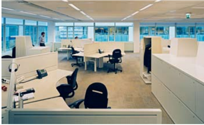
KANTOOR BT MET KASTMODULES